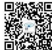
扫码关注恒通评估服务号