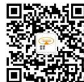
扫码关注恒通发布订阅号